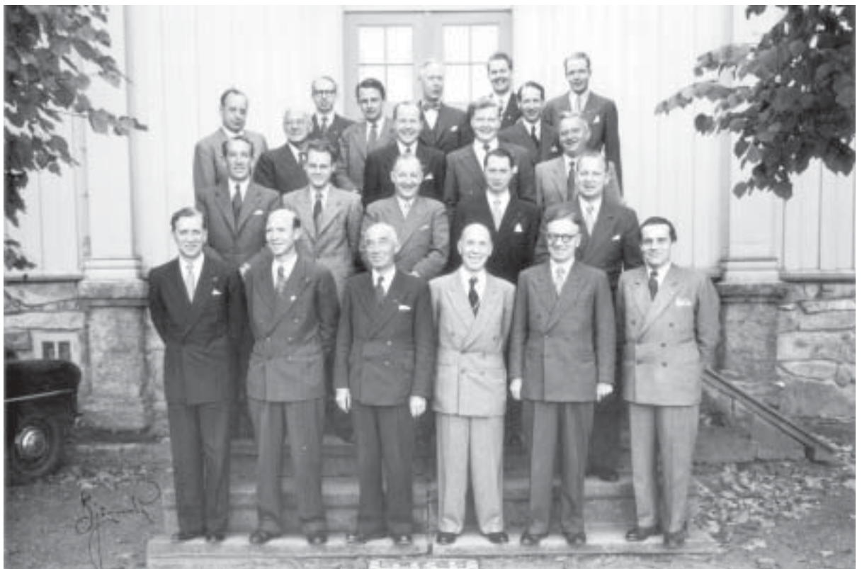
Kursvirksomheten var viktig i Oslo Jernvarehandleres Forening. Her er deltakerne på sjefskurset på Elingaard i oktober 1954.

Korrespondansearkivet går tilbake til 1949, mens kassabøkene også dekker okkupasjonstida. Når det gjelder medlemsprotokoller og styreprotokoller, derimot, går disse helt tilbake til 1800-tallet. I tillegg finnes det en egen serie for det såkalte rabattkontoret som eksisterte fra 1938 til 1961. Arkivet dekker altså en periode på nesten hundre år, og gir innblikk i utviklingen som har skjedd innen en del av handels- og næringslivet i hovedstaden. Av mer kuriøst innhold må nevnes en "kalenderpike"-samling. Lettkledte pinup'er fra sekstitallet var sirlig ordnet etter måned. Disse var tydeligvis vurdert som arkivverdige.