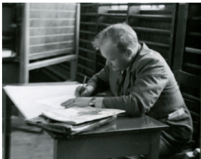
OBA/ Sofienberg skole